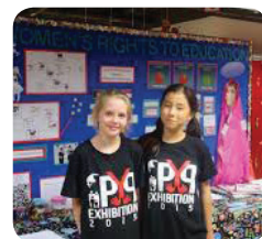
Élèves pendant l'exposition du PP

Pour les établissements et les élèves, l'exposition du PP constitue une excellente occasion de célébrer la transition vers l'étape suivante du parcours éducatif des apprenants.